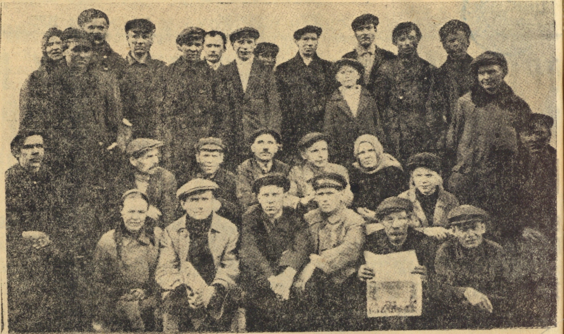
Группа рабкоров газеты «Тяговик» на расширенном заседании заводской редколлегии по подготовке к дню печати.